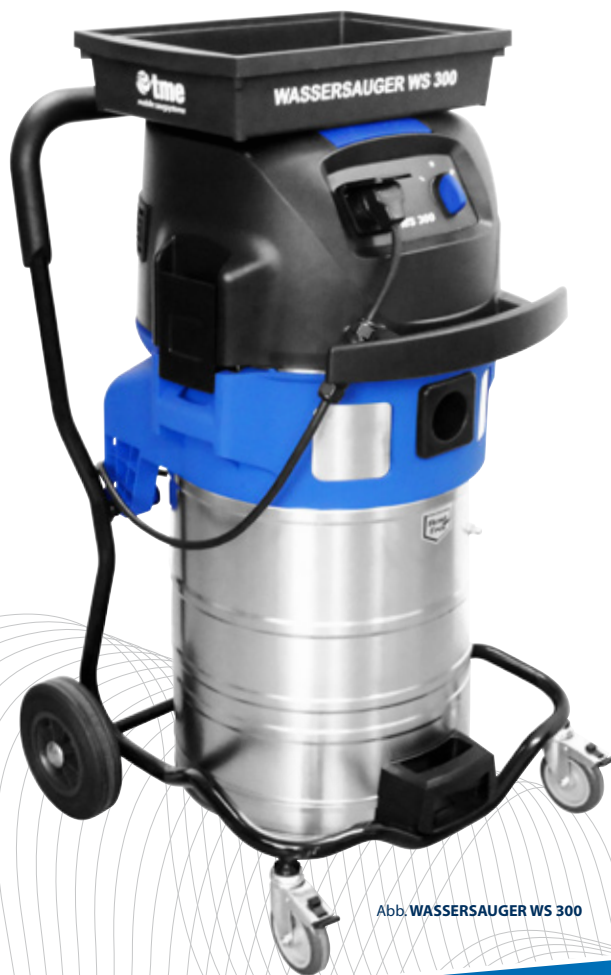
Abb. WASSERSAUGER WS 300

HOCHLEISTUNGS- WASSERSAUGER WS 300 „3 Geräte in einem“